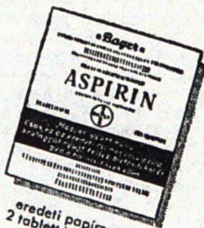
eredeti papírcsokó 2 tablettával 24 fillér