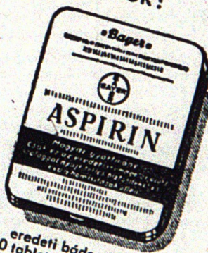
eredeti bádogdoboz 20 tablettával 1.80 pengő

1 tabletta ára 12 fillér "Bayer"-kereszt nélkül nincs Aspirin-tabletta! Aspirin-tabletták csak gyógyszerárakban kaphatók!