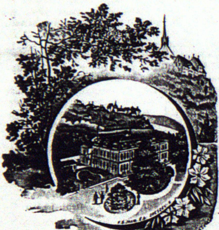
Mildenstein gyógyintézet. Német.

Tüdőbaj. P. R. ur S.-ből tüdőbajának ühleti kezelése után következőket közli velem: „Köszönöm önnek, hogy gyógykezelése által helyre vagyok állítva, stb.“